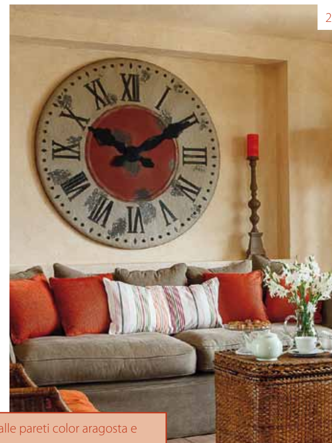
2. Dettaglio del grande orologio del living.