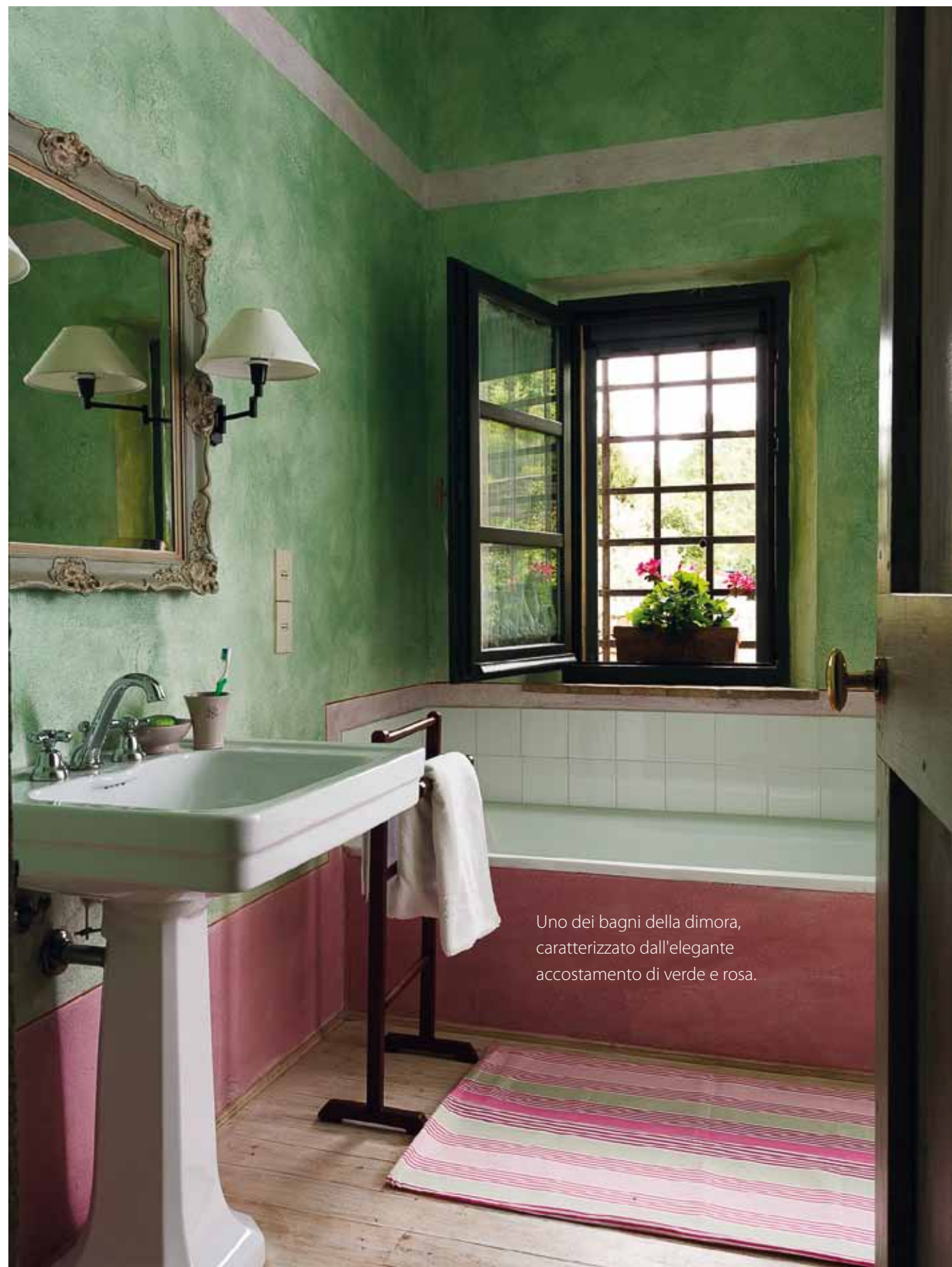
Uno dei bagni della dimora, caratterizzato dall'elegante accostamento di verde e rosa.