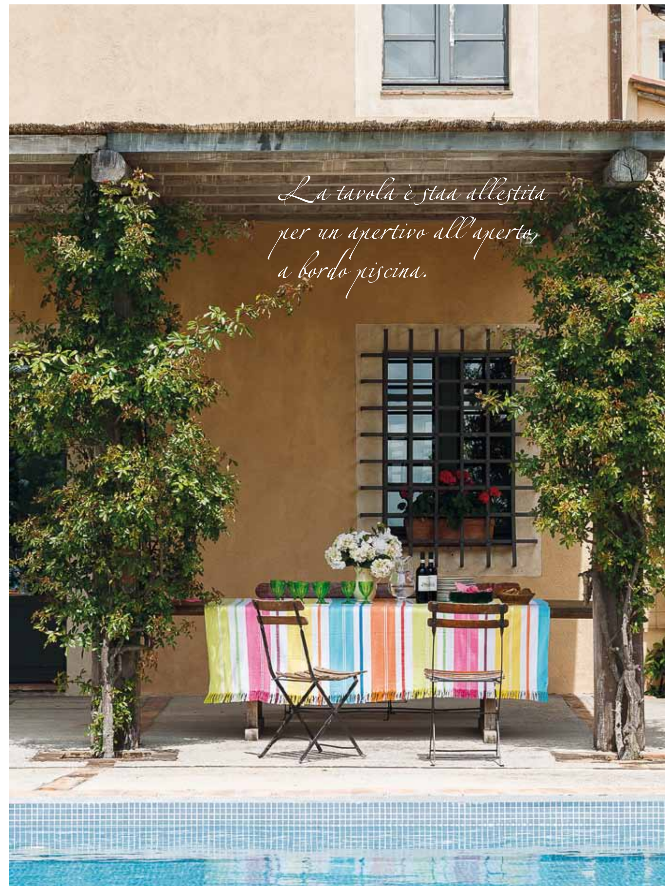
La tavola è staa allestita per un aperitivo all'aperto, a bordo piscina.