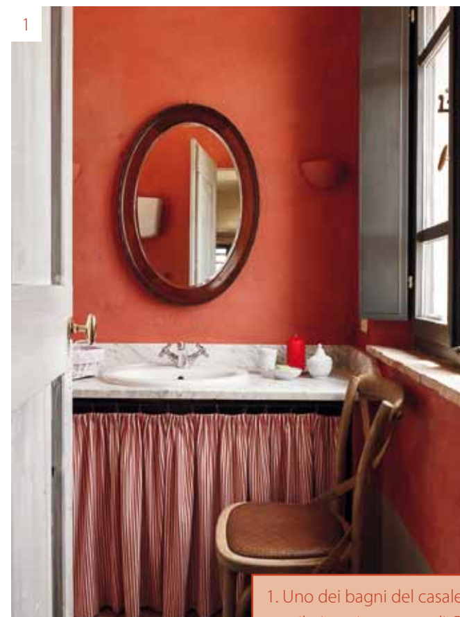
1. Uno dei bagni del casale, dalle pareti color aragosta e con il piano in marmo di Carrara.

Eleganza country chic e semplicità sono le cifre del più autentico lusso che si respira in questo casale.