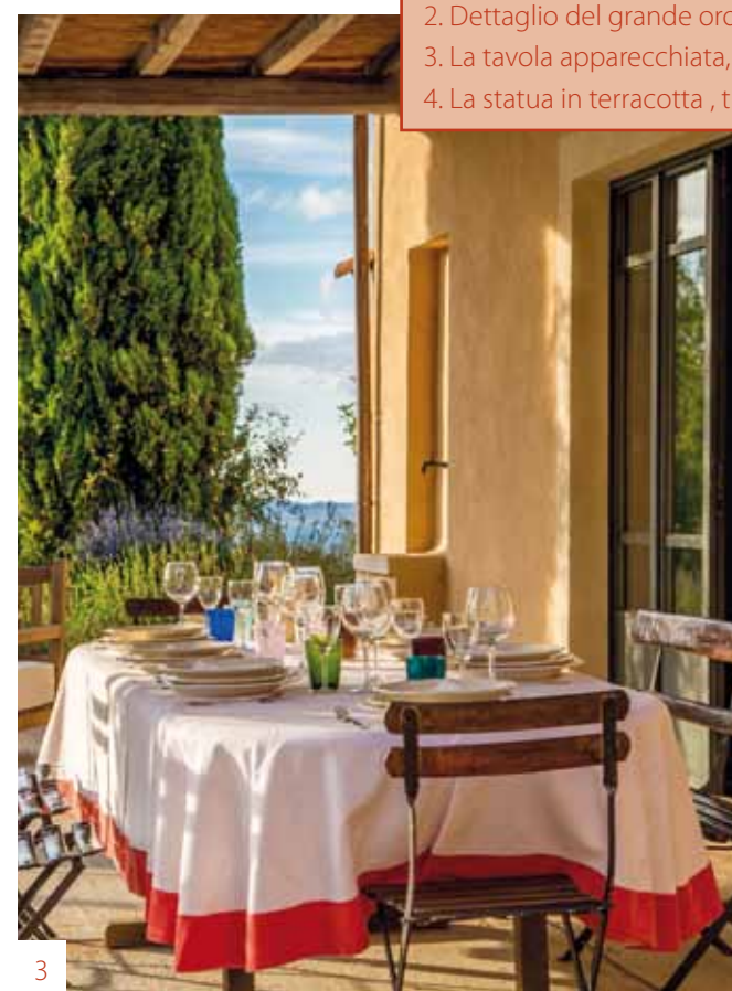
3. La tavola apparecchiata, festosa e colorata.