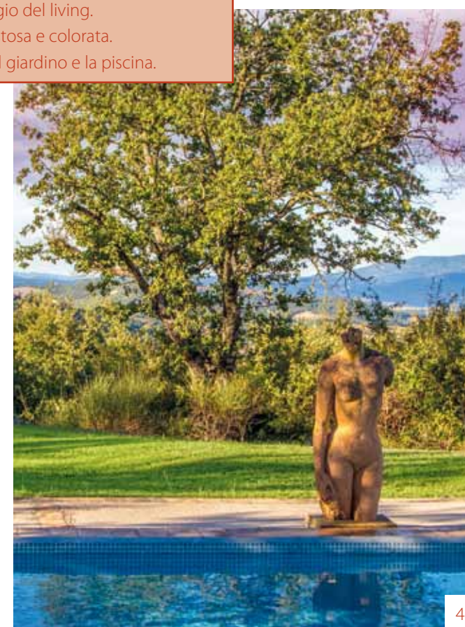
4. La statua in terracotta, tra il giardino e la piscina.